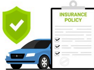
Insurance card بطاقة التأمين