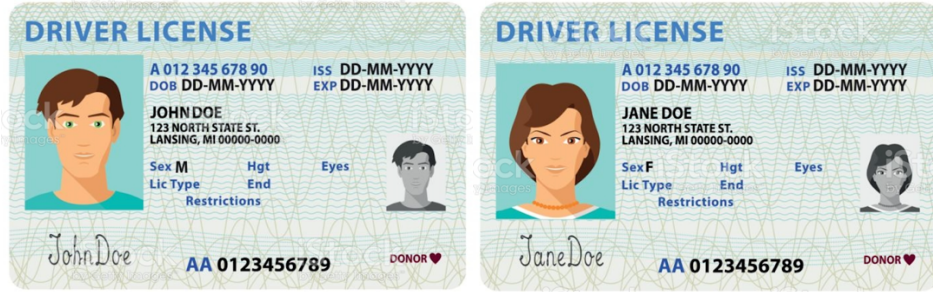
Identification card بطاقة التعريف